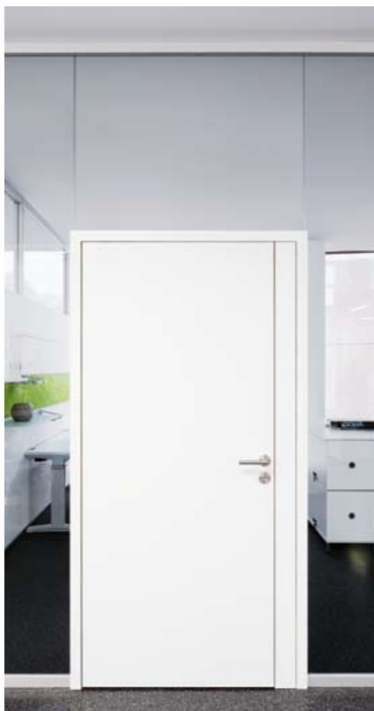
Element: Holz-Türelement fecoplan H60 Türzarge: Aluzarge 35/50T60 pulverbeschichtet weiß Türblatt: Holz-Türblatt 60 mm in Schichtstoff weiß Prüfwert: R_{w,P} = 32 dB, optional 37 dB Seitenteil: fecoplan zargenintegriert beschichtet weiß Glaswand: Verglasung fecoplan in Alu natur eloxiert