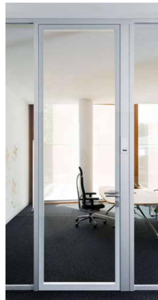
Element: Glas-Türelement fecoplan S60 Türzarge: Aluzarge 35/50T60 in Alu natur eloxiert Türblatt: Glas-Türblatt fecostruct 60 mm in Alu eloxiert Prüfwert: R_{w,P} = 32 dB, optional 37 dB (doppelverglast) Seitenteil: fecoplan zargenintegriert in Alu natur eloxiert Glaswand: Verglasung fecoplan in Alu natur eloxiert