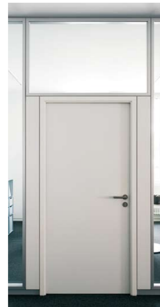
Element: Holz-Türelement H65 Türzarge: Doppelfalz zarge 35/50/15 beschichtet weiß Türblatt: Holz-Türblatt 65 mm in Schichtstoff weiß Prüfwert: R_{w,p} = 42 dB, optional 47 dB (H70-4) Oberteil: Verglasung fecolux in Alu natur eloxiert Seitenteil: Vollwand fecowand in Melamin weiß