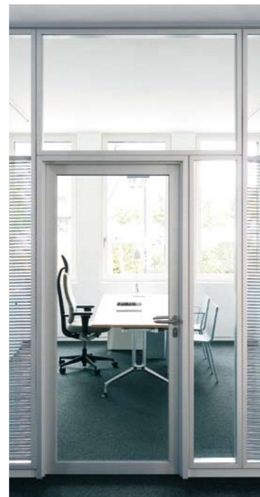
Element: Alurahmen-Türelement A40 Türzarge: Aluzarge 35/35 in Alu natur eloxiert Türblatt: Rahmen-Türblatt 40 mm in Alu natur eloxiert Prüfwert: R_{w,p} = 32 dB, optional 35 dB oder 37 dB Oberteil: Verglasung fecolux in Alu natur eloxiert Seitenteil: Verglasung fecolux in Alu natur eloxiert