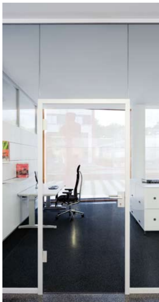
Element: Glas-Türelement fecoplan G8 Türzarge: Aluzarge 35/50T60 in Alu natur eloxiert Türblatt: Glas-Türblatt 8 mm ESG klar Prüfwert: R_{w,P} = 23 dB, optional 32 dB Oberteil: Verglasung fecoplan in Alu natur eloxiert Glaswand: Verglasung fecoplan in Alu natur eloxiert