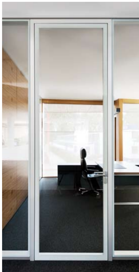
Element: Glas-Türelement fecostruct S60 Türzarge: Aluzarge 18/50 in Alu natur eloxiert für flurseitig flächenbündiges Türblatt Türblatt: Glas-Türblatt fecostruct 60 mm in Alu eloxiert Prüfwert: R_{w,p} = 32 dB, optional 37 dB (doppelverglast) Seitenteil: Verglasung fecostruct in Alu natur eloxiert