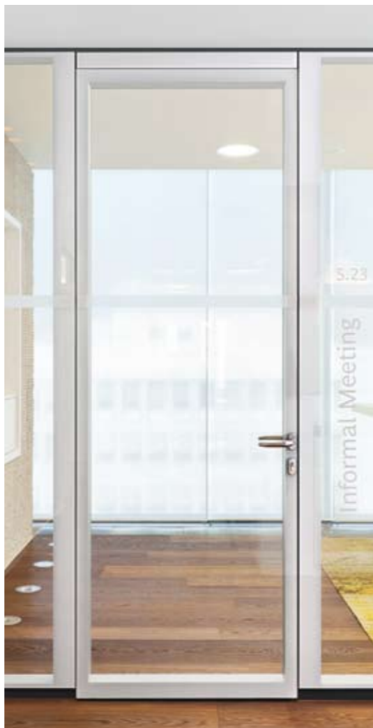
Element: Glas-Türelement fecostruct S105 Türzarge: Aluzarge 35/0 in Alu natur eloxiert, flurseitig verdeckt liegend Türblatt: Glas-Türblatt fecostruct 105 mm in Alu eloxiert Prüfwert: R_{w,p} = 37 dB, optional 42 dB Seitenteil: Verglasung fecostruct in Alu natur eloxiert