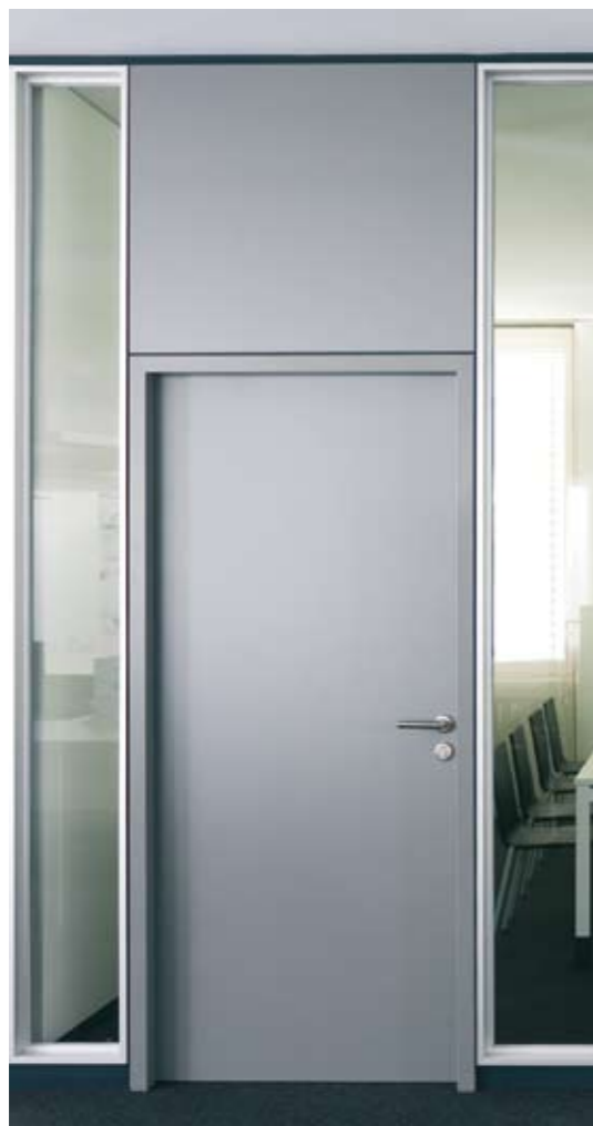
Element: Holz-Türelement H40 Türzarge: Stahlzarge 35/50 pulverbeschichtet staubgrau Türblatt: Holz-Türblatt 40 mm in Schichtstoff staubgrau Prüfwert: R_{w,p} = 23 dB, optional 32 dB oder 37 dB Oberteil: Vollwand fecowand in Melamin staubgrau Seitenteil: Verglasung fecoquic in Alu natur eloxiert