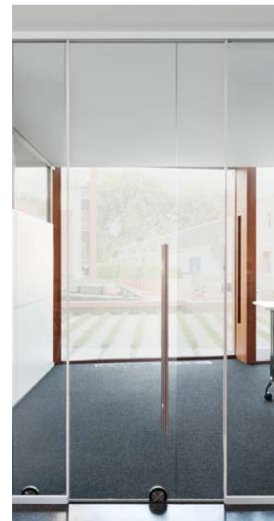
Element: Glas-Schiebetür-Element fecoplan ST10B Türzarge: zargenlos integriert in Nurglaswand Türblatt: Glas-Türblatt 10 mm ESG klar Beschlag: bodenlaufend, alternativ deckengeführt Prüfwert: ohne Schalldämmanforderung Glaswand: Verglasung fecoplan in Alu natur eloxiert