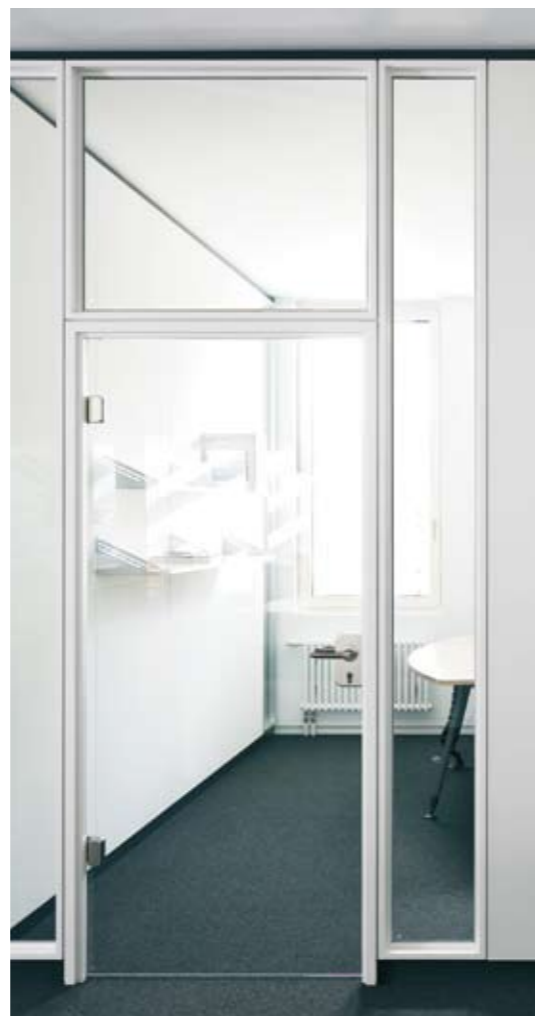
Element: Glas-Türelement G8 Türzarge: Stahlzarge 35/35 pulverbeschichtet weiß Türblatt: Glas-Türblatt 8 mm ESG klar Prüfwert: R_{w,p} = 23 dB, optional 32 dB Oberteil: Verglasung fecoquic pulverbeschichtet weiß Seitenteil: Verglasung fecoquic pulverbeschichtet weiß