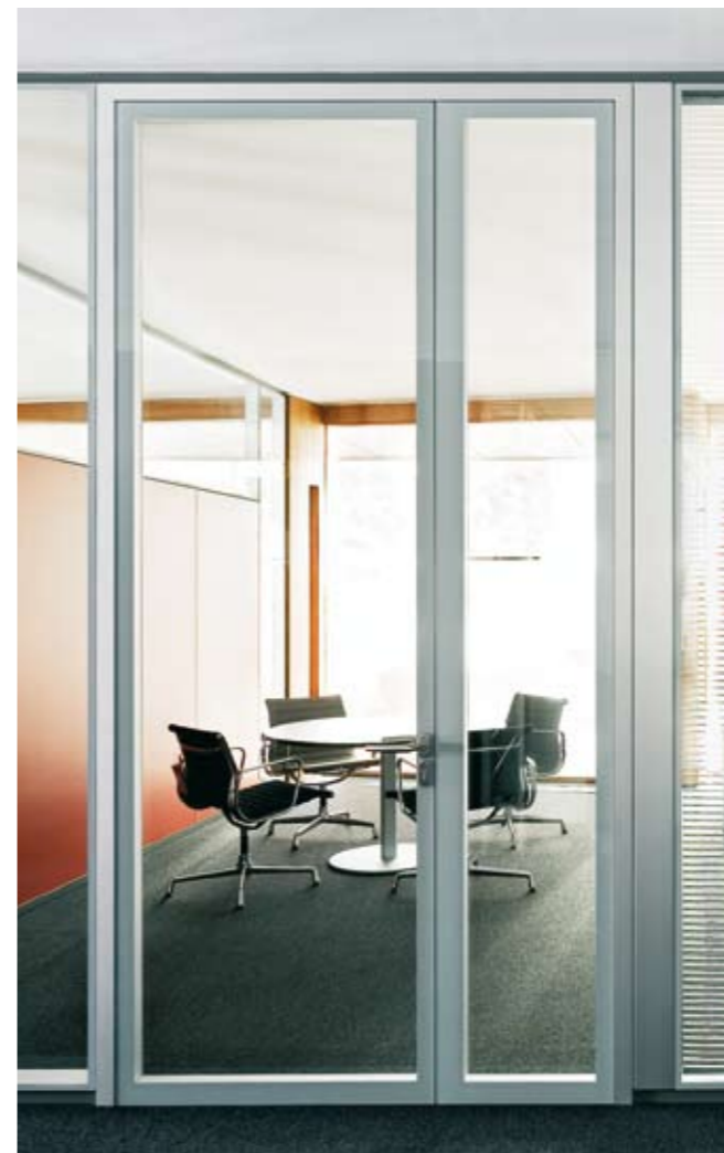
Element: Glas-Türelement fecostruct S60 zweiflügelig Türzarge: Aluzarge 18/50 in Alu natur eloxiert Türblatt: Glas-Türblatt fecostruct 60 mm in Alu eloxiert mit verdecktem Gegenfalz im Standflügel Prüfwert: R_{w,p} = 32 dB, optional 37 dB (doppelverglast) Seitenteil: Verglasung fecostruct in Alu natur eloxiert